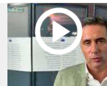
Salini (Fi): "Scontro su Aspi va risolto in Italia, non in Ue"

TAG: coronavirus , app Immuni , pandemia , nuove tecnologie , Almoviva , ultime notizie economia