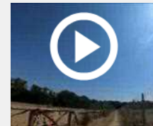
In bici da Roma al Brennero per le persone disabili

ARTICOLO NON CEDIBILE AD ALTRI AD USO ESCLUSIVO DI ALMOVIVA