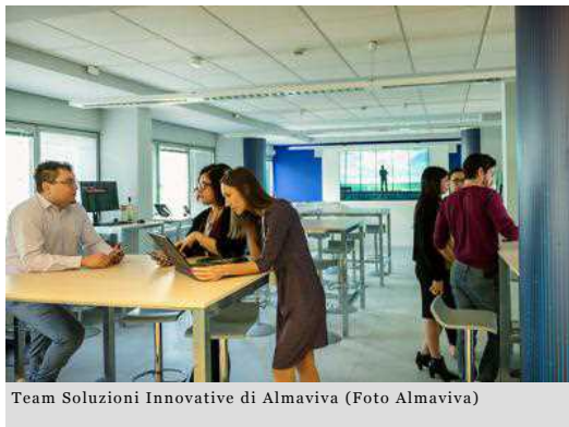
Team Soluzioni Innovative di Almaviva