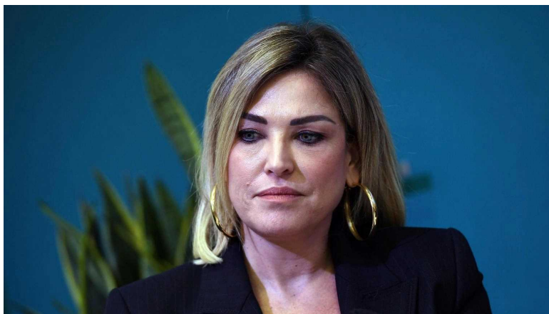
A Almaviva e Almawave la certificazione per la parità di genere